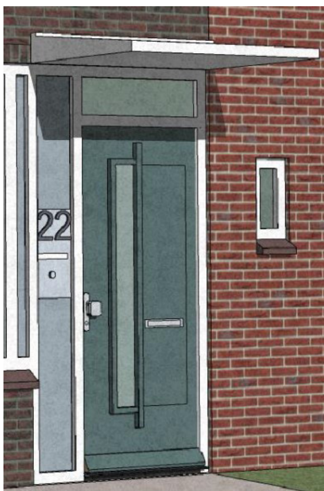
Optie 1 voordeur

We vervangen uw voordeur en achterdeur, inclusief het deurkozijn. U kiest uit 2 opties voor uw voordeur. De deuren krijgen de kleur 'grijsblauw' en zijn goed geïsoleerd en tochtvrij. Ook plaatsen we een luifel boven uw voordeur, en krijgt u een nieuw huisnummerplaatje en beldrukker bij uw voordeur.