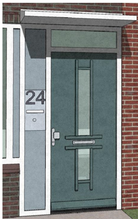
Optie 2 voordeur

U krijgt dezelfde cilinders in uw nieuwe voor-, achter- en bergingsdeur. Zo heeft u maar 1 sleutel nodig om alle deuren te openen en te sluiten. De nieuwe deuren hebben een inbraakveilige driepunts-sluiting.